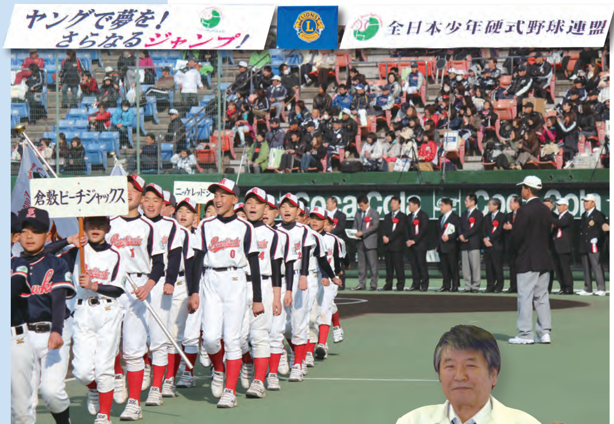
第21回ヤングリーグ春季全国大会