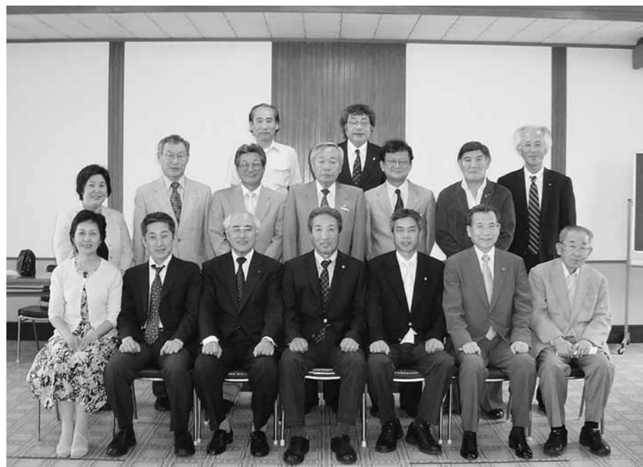
玉島ライオンズクラブ第53期役員