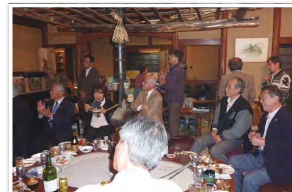
山荘にて花見例会