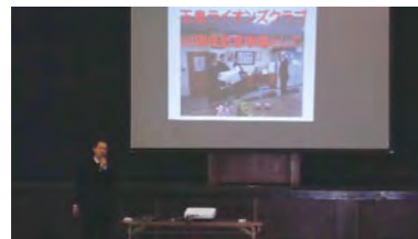
プロジェクター紹介