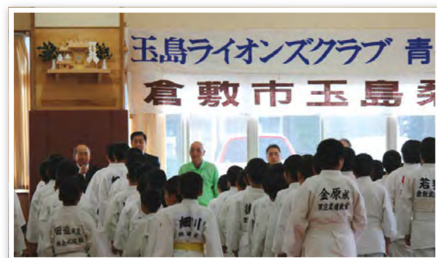
第49回玉島柔道大会

平成7年1月17日の阪神淡路大震災、平成23年3月11日の東日本大震災など未曾有の災害をはじめとし、異常気象が続く中、地域の防災意識を高めようと、東日本大震災被災地・釜石より3名の方を迎え、防災セミナーを開催した。会場いっぱいの人を集め、地域アクトにふさわしい内容であった。昨年に引き続き、倉敷西LCより複合地区ガバナー協議会議長を輩出の関係により336複合地区年次大会・前夜祭を担当。ギリギリまで会場のキャパシティと参加人数に悩まされる事態となったが参加者には喜んでもらったのではないかと。