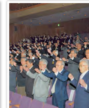
会場一体となったライオンズローア