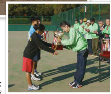
第32回玉島・船穂地区中学校ソフトテニス大会