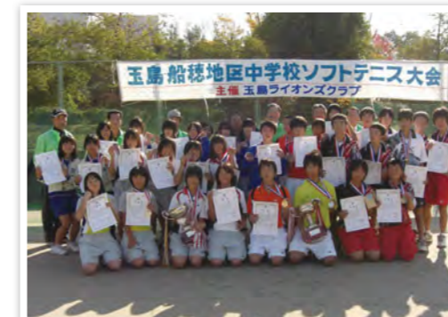
中学校ソフトテニス大会