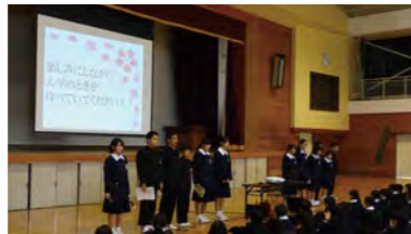
新生オリエンテーション