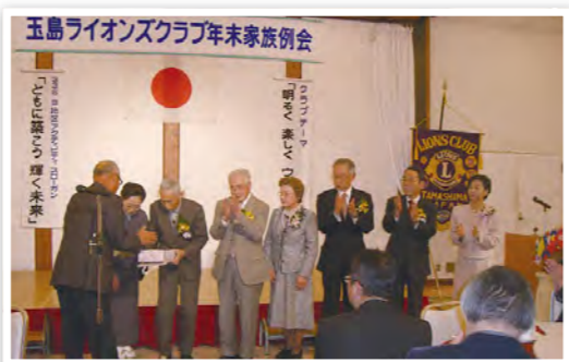
年末家族例会にて慶事のお祝い