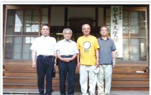
円通寺にて暁天座禅参加