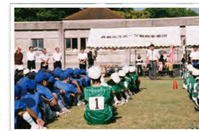
第46回子ども会球技大会