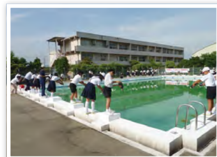
プールへEM菌投入。乙島小学校にて