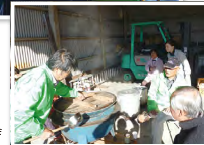
なかよし運動会 炊き出し準備