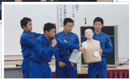
防災セミナーにて消防署職員による救命指導