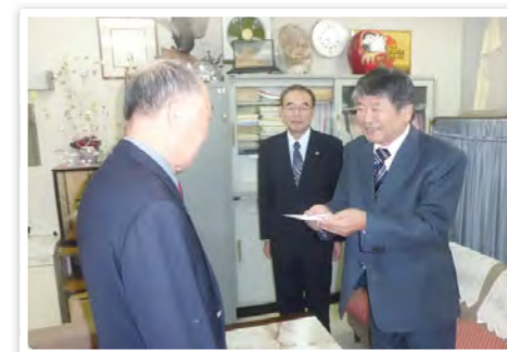
玉島学園へ協力金贈呈