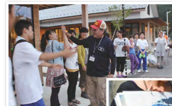
中学生東日本被災地派遣・現地の中学生との交流会