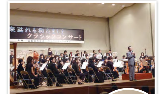
音楽溢れる街たましまクラシックコンサート