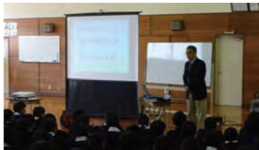
防災・減災講演会