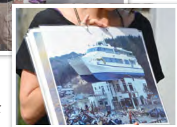
中学生被災地派遣現地にて被害状況を聞く