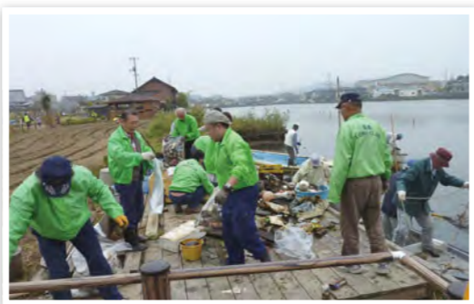
第31回溜川清掃大作戦